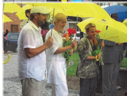
Fot. Marian Modzelewski, Video Wiesław Baclawski, archiwum UM. Więcej zdjęć na www.mragowo.pl